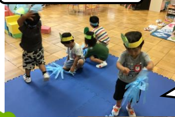
カエル池でピョン♪

栽培では、毎日みんなで水やりをして、成長を楽しみにしています。最近では、トマトが目に見えて大きくなっていく様子に喜びを味わっています。雨上がりの水たまりをみんなで入ってみたり、しずくを触ったり...この時期ならではの体験も教師や友達と一緒にしながら新しい発見を楽しんでいます。