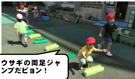
ウサギの両足ジャンプだピョン！