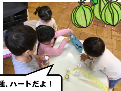
この種、ハートだよ！