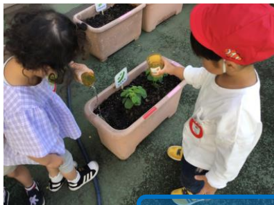
季節ならではの経験

入園して2ヶ月が経ち、少しずつ周りにも関心をもつようになり、年長さんも気になる存在になっています。教師が介さなくても優しくしてくれて、楽しいことを教えてくれるお兄さんお姉さんと自然なやりとりが見られ、遊びの中で年長さんに教えてもらう姿もあり、素敵な関係ができています。