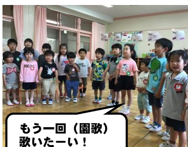
もう一回（園歌）歌いたーい！