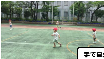
手で自分の力を支えるよ！