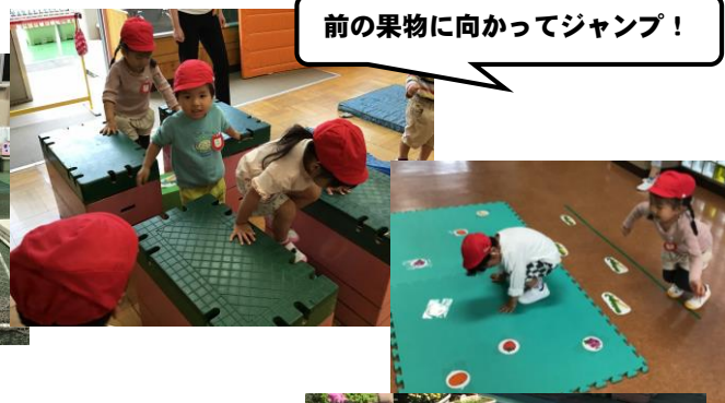
前の果物に向かってジャンプ！