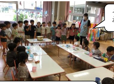
そら組さんが届けてくれたよ!