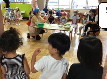
野菜を切っているところを見に行っちゃったよ!

年長さんが作ってくれたカレー カレーのおすそわけを通して、年長さんへの憧れの気持ちや、感謝の気持ち、カレーの待ち遠しさやみんなで同じ物を「おいしいね」と言いながら味わう喜び等、たくさんのわくわくが詰まった行事でした。