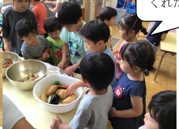
年長さんが野菜を洗っているところを見せてくれたよ!

年長さんが作ってくれたカレー カレーのおすそわけを通して、年長さんへの憧れの気持ちや、感謝の気持ち、カレーの待ち遠しさやみんなで同じ物を「おいしいね」と言いながら味わう喜び等、たくさんのわくわくが詰まった行事でした。