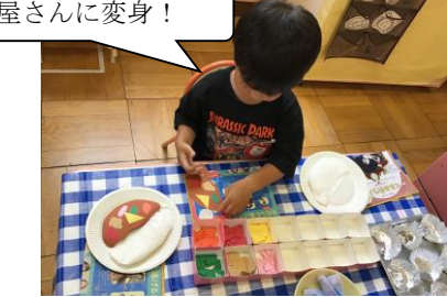
カレー屋さんに変身!

フィンガーペインティングで海を作ろう! ぬるぬるして面白~い! 水遊びの時間では、他にも遊具やばたばたプールの中で水に触れたりと楽しんでます。その模様は、プール参観をお楽しみに!