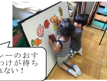
カレーのおすそわけが待ちきれない!