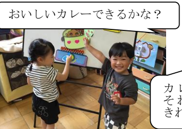
おいしいカレーできるかな?

入園してから3ヶ月余りが経ちました。少しずつ幼稚園生活のリズムが身に付き、身の回りのことが自分でできるようになった喜びや友達と一緒に過ごす楽しさを感じながら、過ごしています。一人一人の、目を見張るような成長ぶりがうれしい1学期でした。保護者の皆様には温かく見守っていただき、ご協力いただきましたことに感謝申し上げます。 明日から、長い夏休みになります。怪我や事故に気を付けて、楽しい夏休みをお過ごしください。 2学期に元気な笑顔の子どもたちに会えることを楽しみにしています。