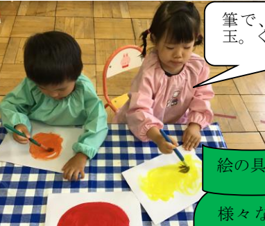
筆で、虹色シャボン玉。ぐるぐる~