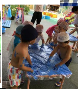
指で波の模様が描けたよ!