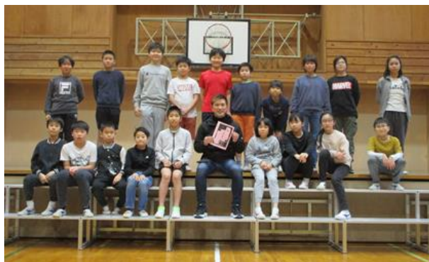
1月20日 学芸的発表会練習

保護者、地域、教育関係の皆様には、本年もご理解とご協力をどうぞよろしくお願いいたします。