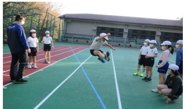
校庭が使えるようになりました！

保護者、地域、教育関係の皆様には、本年もご理解とご協力をどうぞよろしくお願いいたします。