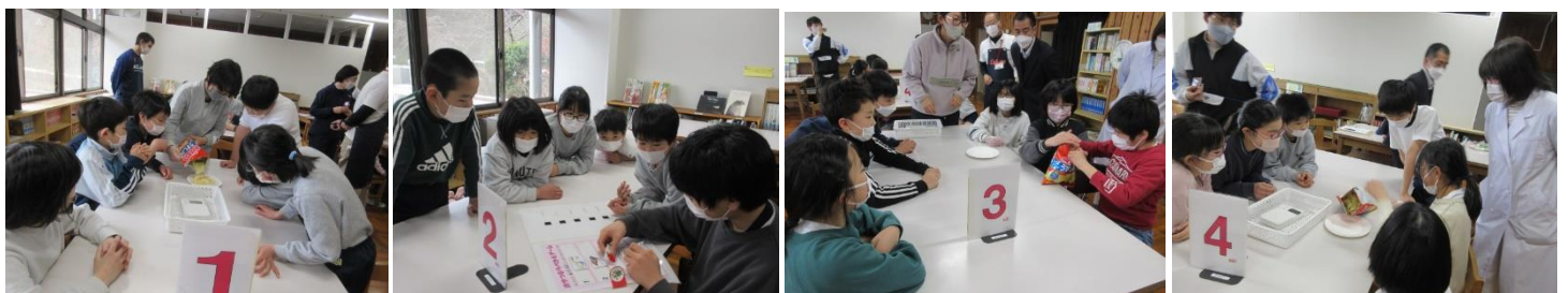
「カルビー・スナックスクール」の様子 一日に食べていいスナック菓子の量はどのくらいだろう…