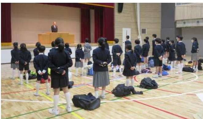
3学期のスタート！ 【城東小体育館にて】