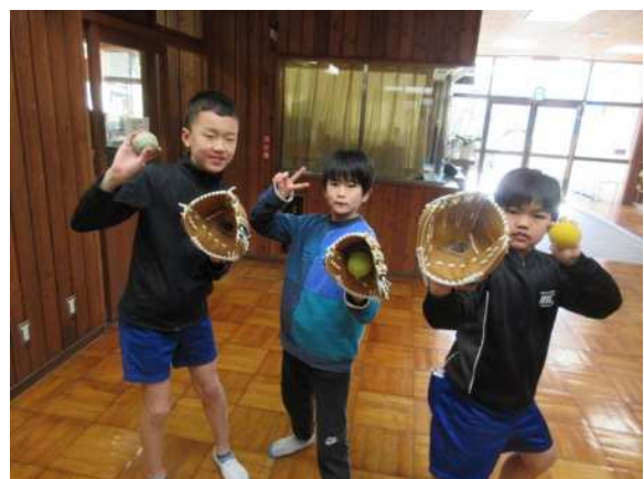
大谷選手からグローブが届きました！