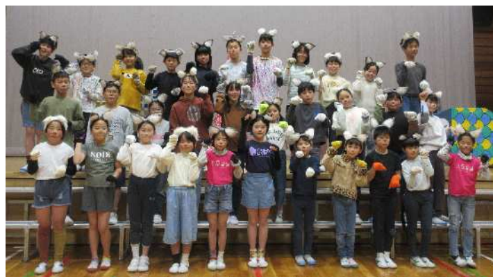
「学芸会」11ぴきのねこ