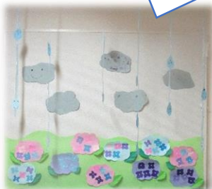
きれいなあじさいが たくさん咲きました!

季節の製作は、経験した技法を遊びに生かしたり、イメージをもって楽しんだりできるよう工夫していきます。