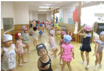
みんなで準備体操♪

ご家庭でも、早寝、早起き、朝ごはん、毎日の体調管理と健康チェックにご協力よろしくお願いします。