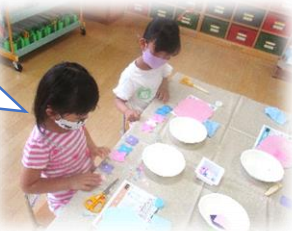
お花がいっぱい できてきたね!