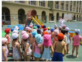
~プール開き~ 約束のお話を聞いています。