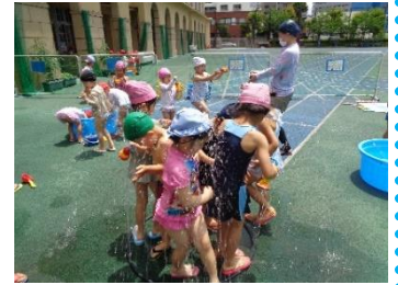
シャワーきもちい~い!