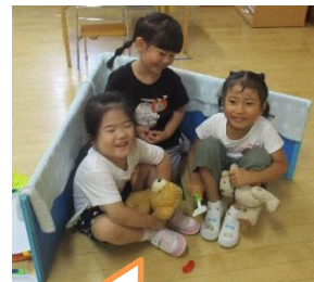
おうち! 赤ちゃんと一緒にの!