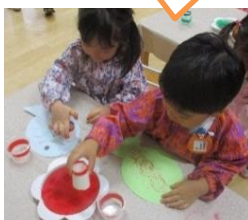
お魚作るよ! べったん!べったん!