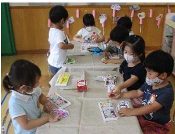
見ててね! くるってするよ!