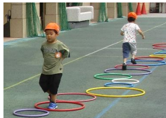
パカポコ、ちよ っと難しいな