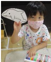
みてみて! 赤で作る

保育室の壁面を海に変えると、「おさかながない!」と気づき、お魚を作ることにになりました。魚型の画用紙にトイレットペーパーの芯を使ってうろこを表現した魚を製作しました。赤、青、緑色のスタンプから一色を選んで隅々までスタンプする子、三色使って色とりどりにスタンプする子、家族の分も作る子、個性が溢れた魚ができました。保育室の海を気持ちよさそうに泳いでいます。ウレタン積み木で救急車や消防車を作るお友達を見て、病気になってしまった赤ちゃんや動物を抱いて病院に行きたいお母さんが「のせてください。かぜひいたので、びょういんにおねがいします。」とお願いすると、「はやくのってください。」と運転手さん。病院に着くと「ちょっとまっててください。じゅんばんにみます。」とお医者さんが優しく治療してくれます。治療が終わるとアイスクリーム屋さんやレストランでおいしい料理を食べて、ますます元気になります。自分のやりたい役やなりたい役のつもりになって楽しむ様子が沢山見られました。今後も子どもたちの興味ややってみたいことを表現できるように、環境や教材を整えていきたいと考えています。