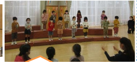
先生やお友達と一緒にうれしい♪