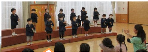
みんなで鳴らすと 音がきれい♪