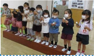
りす組ことり組一緒に ドングリマラカス♪

当日は、教師や友達と一緒に、自分なりに鳴らすことを楽しんでいる様子を温かい笑顔で見守っていただけたらと思います。