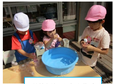
草花を使った色水遊び