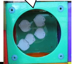
お化け屋敷ごっこ