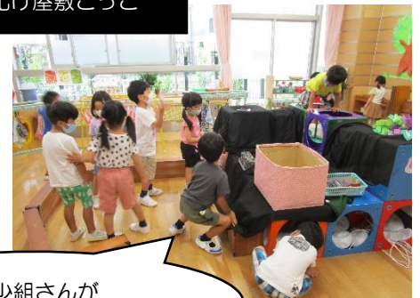
年長・年少組さんが お客さんで来てくれました