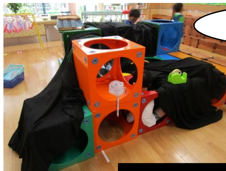
中にお化けがいます