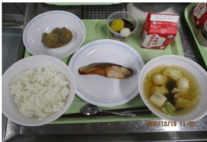
食育講演会とその日の給食

さて、12月半ばに和食の魅力について、日本料理の専門家にお越しいただき、実際に給食を作りに入ってもらいました。昼の放送でその日の給食について解説していただくとともに、6校時に和食の魅力について講演をしてもらいました。冬至とはどんな日か、和食は健康面に良いことはもちろん、その季節にあった旬があり、そして時期にあった器などの食器に盛り付けることなど、和食文化の奥深さを学びました。関東のお雑煮と関西のお雑煮は違うと聞きましたが、皆さんはお正月にどのようなお雑煮を食べましたか？地域独特のお雑煮を調べて、作って、食べて、和食の素晴らしさを感じられると良いですね。この1年、皆さんにとって健康で、充実した実り多い1年になることを心から願っています。今年も「完全燃焼」して、「後悔のない」1年を過ごしましょう