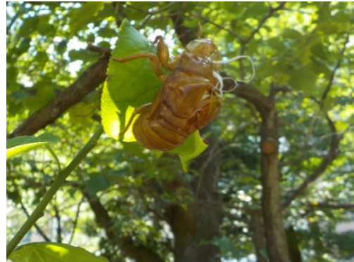
(こたえは「せみのぬけがら」です)