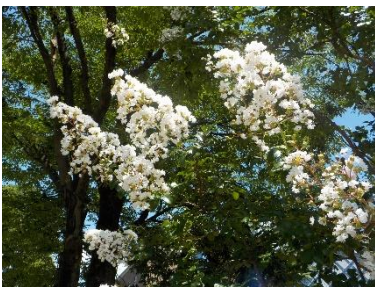
(せいかいは、「さるすべり」です)

◎あついなつのたいようのしたで、しろやびんくのきれいなはなをさかせる「き」です。