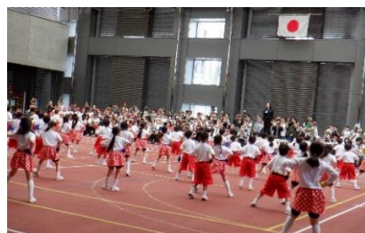
1・2年：「Let'sジャンボリー」