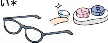
眼科検診…メガネ、コンタクト