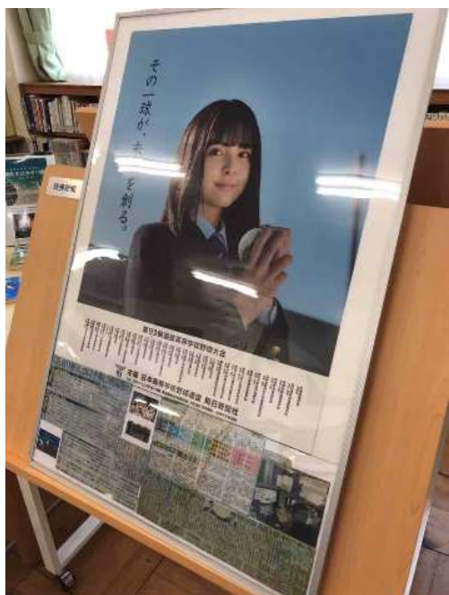
春の選抜甲子園 リモートによる抽選会