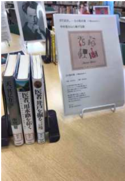
中村哲の世界 さだまさしの曲の紹介