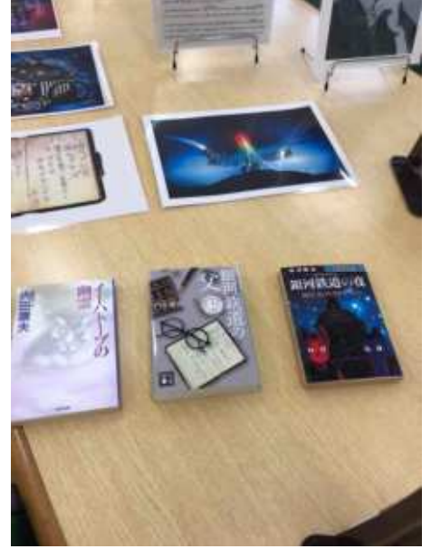
藤城清治の切り絵