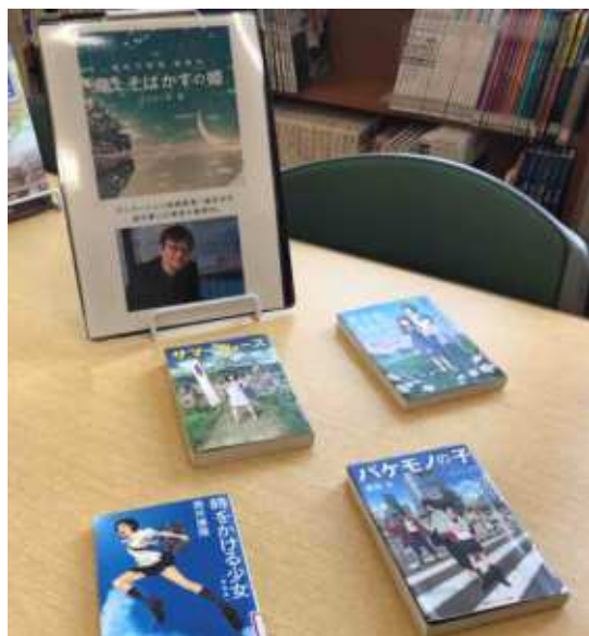
細田守監督 アニメのノベライゼーション