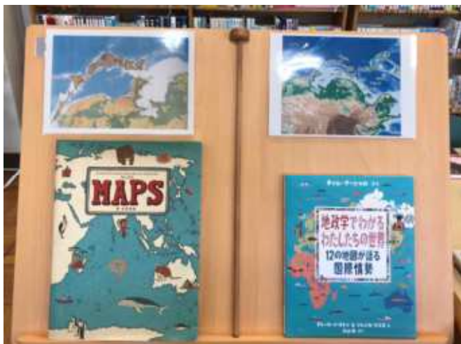
逆さ地図 大陸から日本を考える 地政学