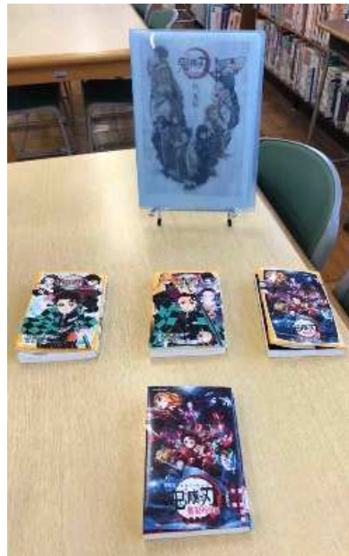
ノベライゼーション 「鬼滅の刃」の作品紹介