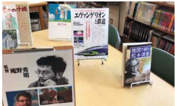
庵野秀明監督 アニメの世界