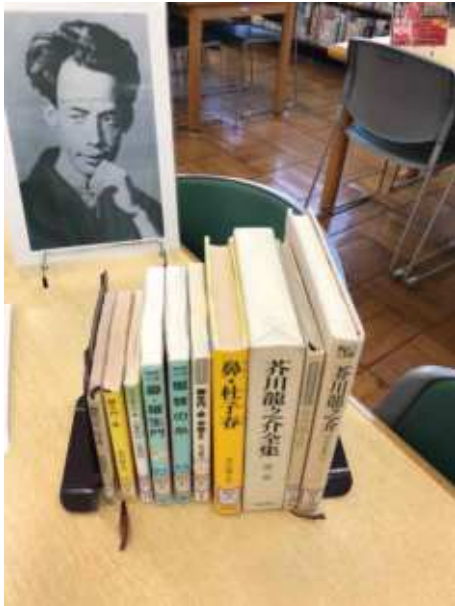
芥川龍之介作品紹介