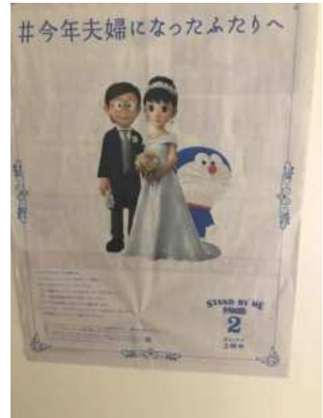
2020年11月20日(金) 読賣新聞 朝刊広告

その日、朝陽に照らされて新聞を読んでいると、どうも後ろの広告が透けて見えている。映画「STAND BY ME ドラえもん2」の宣伝らしい。それも「のび太君」と「しずかちゃん」が結婚する(?)みたいだ。この新聞広告をライトで照らし表と裏が同時に読めたら、面白いなあ、と思ったのがきっかけでした。