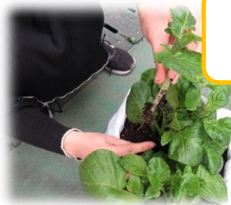
こ～んなに ぬいたよ。