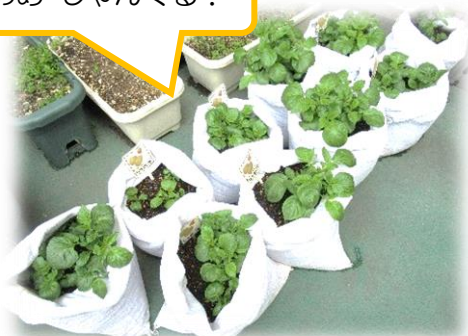
じゃがいものめ じゃんぐる!