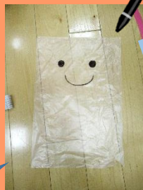
今度は、袋にペンで顔を描きます。