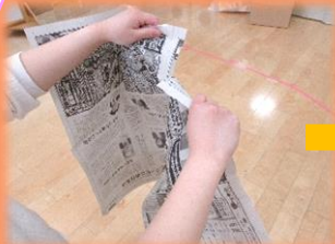
まずは、新聞紙の端を両手で持ってみよう。

15号で紹介した空き箱タワーを的にして新聞紙ボールを投げて遊ぶことも楽しいですね☆