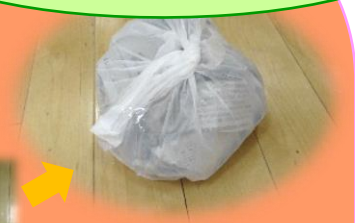
もう一つ、新聞紙ボールができたよ!