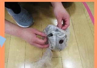
袋の真ん中を絞って、テープで留めます。新聞紙を入れた方の角もテープで留めると...