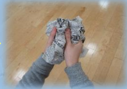
小さくなってきたよ