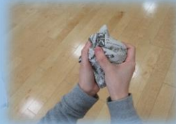
もっと力を入れて握ると...