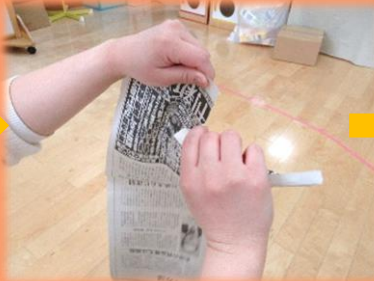
お母さん指(人差し指)とお父さん指(親指)に力を入れて、右手(もしくは左手)を下に引っ張ると、ちぎれるよ。