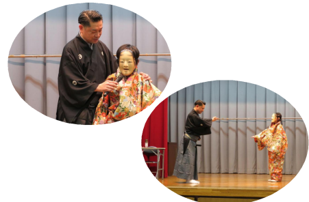
能楽鑑賞教室事前より学習