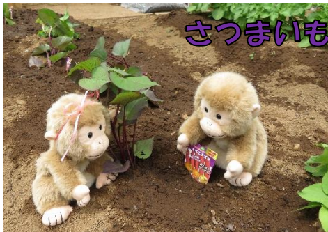
さつまいものなえうえ