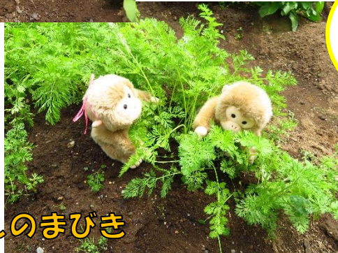
にんじんのまびき