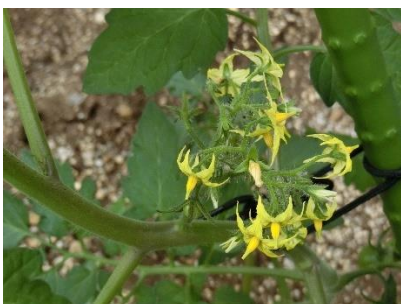
ミニトマト:花が咲きました

みんなのミニトマトの苗より一足先に、学校の畑に植えました! こんなに大きくなりました。