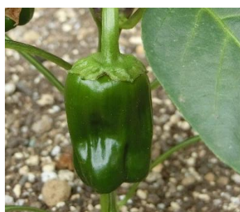
ピーマン:実がなりました