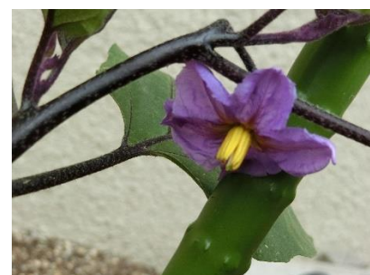
クイズ:何の花でしょう??