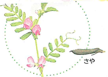
ヤエムグラ はる のはら あそぶ