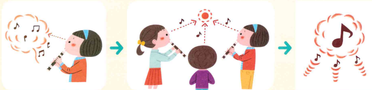
自分の吹いた音を「見る」感じて吹く