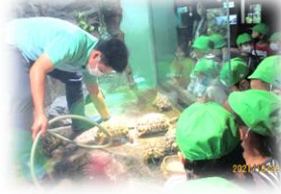
カメさんのお掃除中♪ ダイバーさんが魚たちにご飯タイム♪