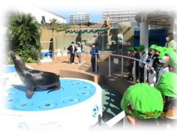
アシカさんはショーの練習中！