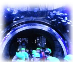
クラゲのトンネル！

水族館への遠足もとても楽しみにしていました。行ったことがある子も半数くらいいましたが、幼稚園のみんで行くバス遠足ではまた違った楽しさを感じることができたようです。様々な海の生き物に、興味津々で、「この魚知っているよ！」「ペンギンのお腹って膨らんでいてかわいいね！」「この子の名前、〇〇ちゃんだって！一緒だね！」等と、友達と楽しさや発見したことを伝え合いながら見ていた姿から、さすが年長組だなと感じました。みんなで経験した楽しかったことを今後の遊びにも生かしていきたいと思えます。