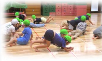
遊戯室で、裸足になってのびのびと表現遊び♪ コツメカワウソが遊んでいるところ！ みてみて！アシカのポーズ！