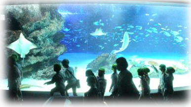
サメがいる！エイも！