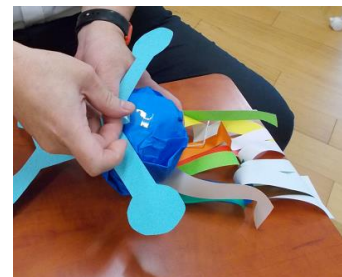
⑥頭部と体を付ける