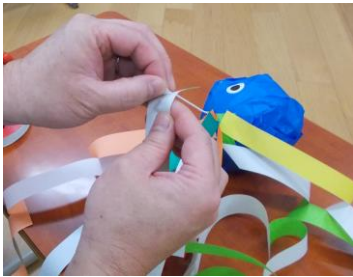
④両面テープで頭部に髪を付ける