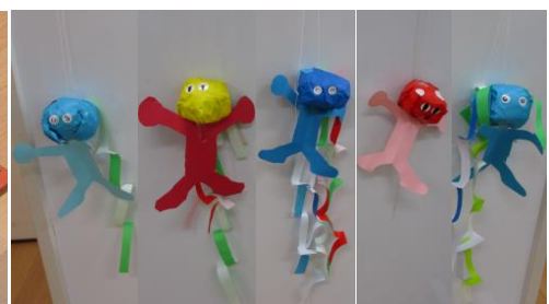
個性豊かな制作活動となりました

例年の制作活動では、友だちと話し合い、協力して共同作品を制作するのですが、制限の多い中での今年度の活動では叶いませんでした。今後は、感染状況を見ながら、友だちと心をつなげて作品を制作する活動も取り入れていきます。